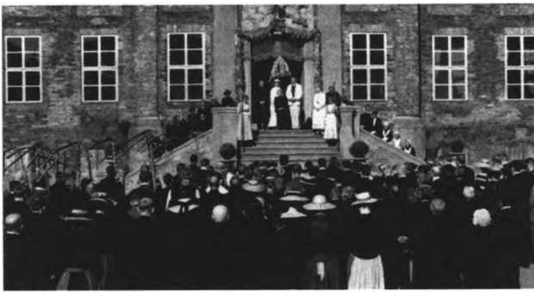
“Beyaz Bant”, 2009

Lukács'ın tarihsel roman ile ilgili övgüleri hemen herkesçe bilinir. Kuramcı, tarihsel roman ile neyi kastettiğini, ‘Tarihsel Roman’, ‘Çağdaş Gerçekçiliğin Anlamı’, ‘Avrupa Gerçekçiliği’ ve ‘Avrupa Edebiyatı ve Varoluşçuluk’ gibi kitaplarında örnekleriyle anlatır ve bu kitaplarda, tarihsel romana özgü iki temel özelliğin öne çıktığı görülür. Lukács, ‘bütünlük’ ve ‘tipiklik’ gibi kavramların tarihsel bir roman için vazgeçilmez bir çerçeve olduğuna ve Balzac, Flaubert, Zola, Tolstoy ve Stendhal gibi birçok romancının bu biçimsel zorunlulukları yerine getirme becerileri ile çağdaş romancılara örnek olabileceğine dikkat çeker. Bu, romanda üretim ilişkilerinin küçük bir evreninin yaratılarak, bu ilişkileri temsil eden karakterin kendi sınıfsal aidiyetleri ile birlikte resmedilebilmesidir. Lukács, çağdaş romanı, tarihsel romanın yolunu tutmayıp, modern dönemin yeni sanatsal yönelimlerinin etkisinde kalması nedeniyle de eleştirir. Çağdaş romanın, kimi örnekleri ile Lukács'ın övgüsünü almış olsa da tarihsel romana ait anlatım özelliklerinin artık miladını doldurduğu ve eleştirel yeteneğini yitirmiş olduğu için farklı anlatım yollarına başvurması anlaşılabilir bir tercihtir. 8