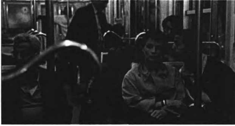
"Bilinmeyen Kod", 2000

azından ara sıra) harekete geçmeyi de bırakmış değiliz. Aslında durum tam tersi gibi görünüyor: Benliğin kendi kendine gönderme yapmasının fevkalade yükselişi, paradoksal bir şekilde, insanların ıstırabına karşı artan bir hassasiyetle, hatta en uzaktaki yabancıların maruz kaldığı şiddet, acı ve ıstıraba duyulan nefret ve (çare bulmaya yönelik) yoğunlaşmış hayırseverlikle omuz omuza gider. Ancak Lipovetsky'nin doğru bir şekilde gözlemlediği gibi, bu tür ahlaki dürtüler ve yüce gönüllülük feveranları, zorunlulukları ve uygulamaya yönelik yaptırımları elinden alınmış, 'Ego önceliğine uyarlanmış' olan 'acısız ahlak' örnekleridir, insanın kendisinden başka bir şey uğruna' harekete geçmesine sıra gelince, tutkular, Ego'nun esenliği ve fiziksel sağlığı her şeyin önüne geçer ve etmek istediğimiz yardımın sınırlarını belirler... Çoğunlukla 'kendimizden başka bir şeye (ya da kişiye)' bağlılık dışavurumları her ne kadar içten, hevesli ve ateşli olsa da fedakârlık noktasına varmadan durur..." (Bauman, 2013:65,66)