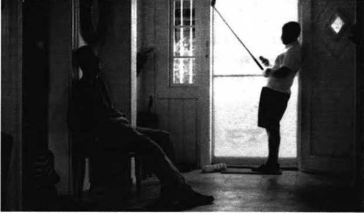
“Ölümcül Oyunlar”, 1997

“Ölümcül Oyunların temel önermesi basittir: Sempatik, zengin, uyumlu bir aileyi yazlıklarında komşularının misafirleri olduğunu iddia eden iki iyi giyimli genç adam ziyaret eder. İlerleyen saatlerde bu iki kibar, konuşkan yabancı aileyi artan bir şekilde sadistleşen, zaman zaman doğrudan izleyici ile konuşma biçiminde film aksiyonunun dışına taşan tartışmalarına katılmaya zorlar. Bu, kenarda kalan dramatikleştirme tekniğinde yeni hiçbir şey yoktur. Brecht bundan faydalanmıştır. Shakespeare bütün oyunlarını bunun etrafında inşa etmiştir. Antik Yunan korosu başka bir amaca hizmet etmez, fakat film bilinen heyecan dolu klasik film akışının aksi bir biçimde son derece rahatsız edicidir. İki genç adam kurbanları ile açıkça dalga geçer; fakat bu aşağılamaların çoğu seyirci tarafından kabul edilir.” (2007: 2) 4