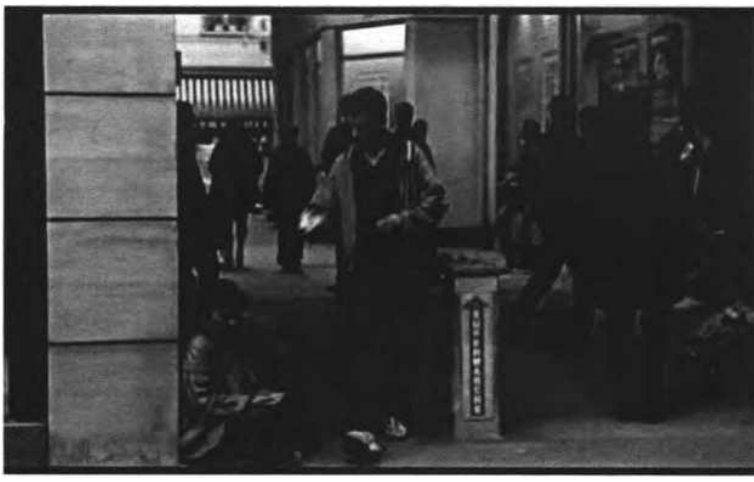
"Bilinmeyen Kod", 2000

Geleneksel film diline ait bileşenlerin neredeyse hemen hepsi, Haneke elinde modern hayal kırıklıklarını yansıtan bir araç haline dönüşür. Schubert'in bestelerinin Isabelle Huppert ile birlikte başrolü oynadığı 'Piyano Öğretmeni' ("The Piano Teacher", 2001), geleneksel film diline ait önemli bir bileşen olan müziğin, bu türden kullanımı için etkileyici bir örnektir. Aslında derin bir bilgi birikimini gerekli kılması bile tek başına müziklerin geleneksel işlevinin dışında kullanıldığını göstermesi açısından yeterlidir. Ancak müziğin geleneksel kullanımı ve bu kullanımın koşullandırdığı seyir alışkanlıkları, Schubert bestelerinin kullanım amacı konusunda seyredenleri ve hatta film kurdu eleştirmenleri dahi yanıltabilmektedir. Bu alışkanlıklar, seyredenleri ve eleştirmenleri, ana karakterlerin, sahnelerin ve sekansların duygu durumu ile müziğin akışı arasında bir ilişki kurmaya zorlayabilmektedir ki bunun gibi filmlerde müziğin yabancılaştırıcı bir 'enstrüman' olarak kullanıldığını görmeye de engeldir.