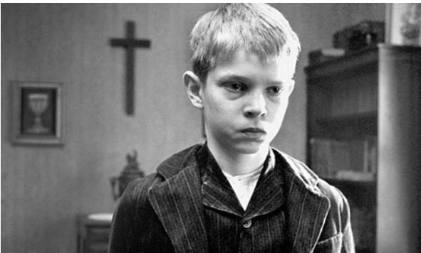
“Beyaz Bant”, 2009

Haneke'nin ‘Saklı’dan sonra çektiği filmi, ‘Beyaz Bant’tır. İlk bakışta Beyaz Bant, özellikle Lukács’ın tarihsel romanı tanımlarken kullandığı nitelikleri taşıyan tarihsel bir film gibi görünür. Birinci Dünya Savaşı’nın hemen öncesinde, feodal ilişkilerin hâkim olduğu bir Alman kasabasında yaşanan olaylar silsilesi, Alman toplumunun küçük bir evreni içinde kurgulanarak anlatılmış gibidir. Üstelik filmin geleneksel anlatı saflarına dâhil edilmesini kolaylaştıracak birçok çatışmayı içinde barındırdığı bile söylenebilir. Filmin erkek kahramanlarından birinin zaman zaman anlatıcı olarak film akışına müdahalesi, heyecanı doruğa taşımayı kolaylaştırır. Ancak heyecan hiçbir zaman doruğa ulaşmayacaktır. Çünkü filmin sorunu anlatısı ile örtüşmeyecek kadar tematiktir. Kasabada yaşanan ve tarihsel olarak zamanın Alman toplumuna özgü gibi gözükken hemen her şey, uygarlığa ait evrensel sorunlardır. Toplumsal adalet talebinin sağlanamadığı bir topluluğun içgüdüsel dışavurumları tartışılmakta, libidonun ve saldırganlığın, uygarlığın yararına, özellikle çalışmanın kutsallığına dem vurarak kullanımının işe yaramazlığına dikkat çekilmektedir. Dürüstlüğü, saflığı, yardımseverliği ve aslında ‘komşunu kendin gibi sev’ düsturu (Freud, 2004: 65) sayesinde toplumsal birliği sağlamaya yönelik çabası ile kasabanın papazı dahi ikiye yüzüdür.